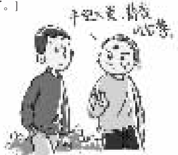
钱元平 辑录 任山威 配图