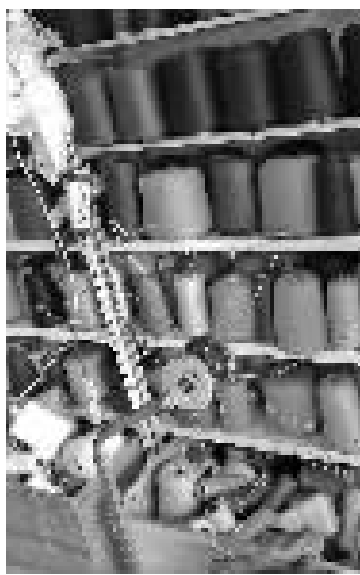
店里的机器主要用来整理羊绒线，而不再从事编织了。

店里的羊绒线分成两档，分别为480元一斤和680元一斤。一件女式基本款打底衫需要耗费半斤羊绒线，加上100~200元的加工费，消费者花600~800元就可以