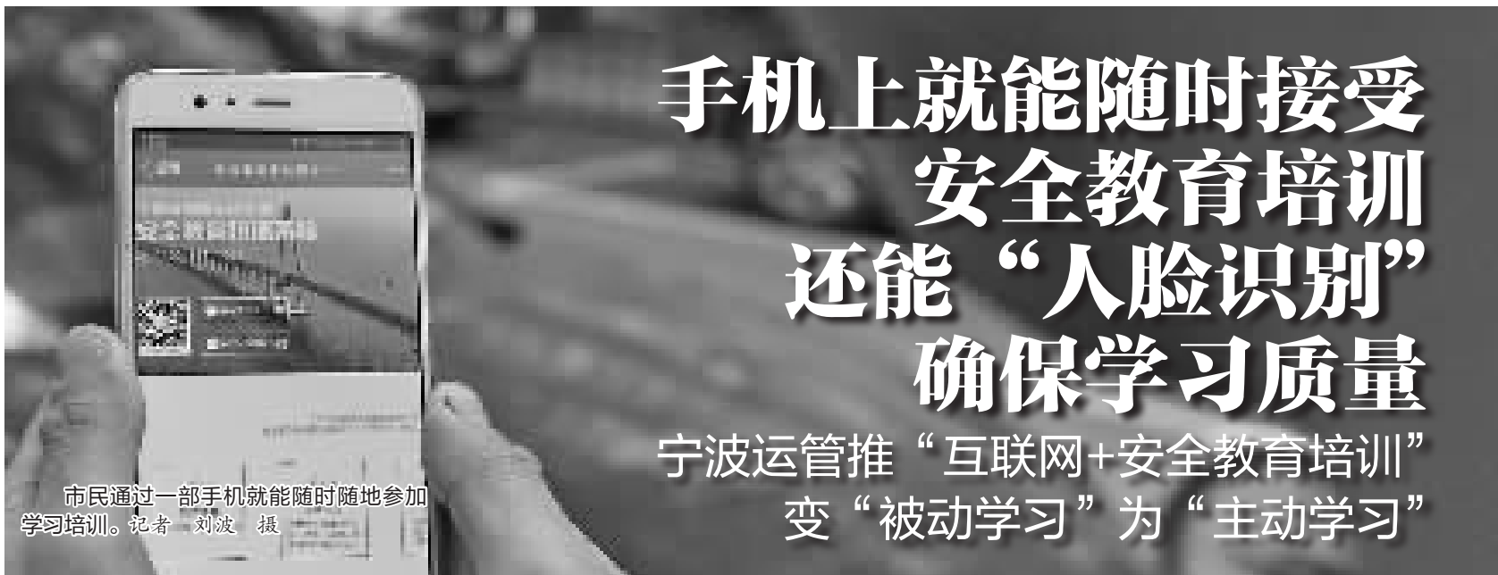
市民通过一部手机就能随时随地参加学习培训。

道路运输企业开展对员工的日常安全教育培训是依法履行安全生产管理主体责任、提高企业安全生产水平的一项基础性保障工作。