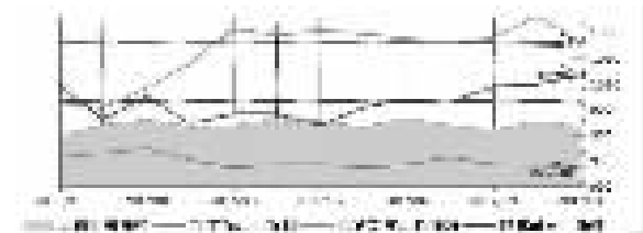
2016年11月—2017年11月公路货运价格指数变化图

11月，宁波市公路货物运输价格指数小幅回落，报收969.82点，环比微跌0.62个百分点，同比增加1.05个百分点。公路货物运输市场景气指数小幅下跌，报收1003.08点，环比下降3.64个百分点，同比上涨1.72个百分点。