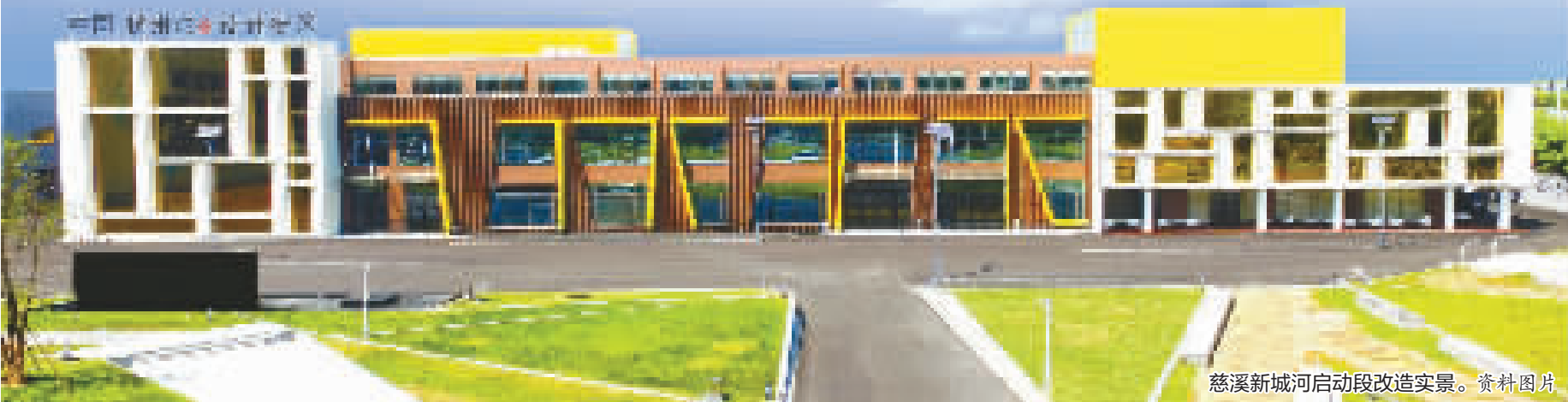
慈溪新城河启动段改造实景。