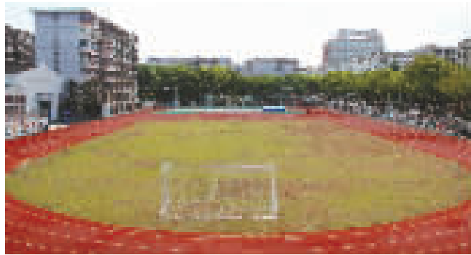
鄞州曙光中学在拆后场地上新建200米非标跑道。资料图片