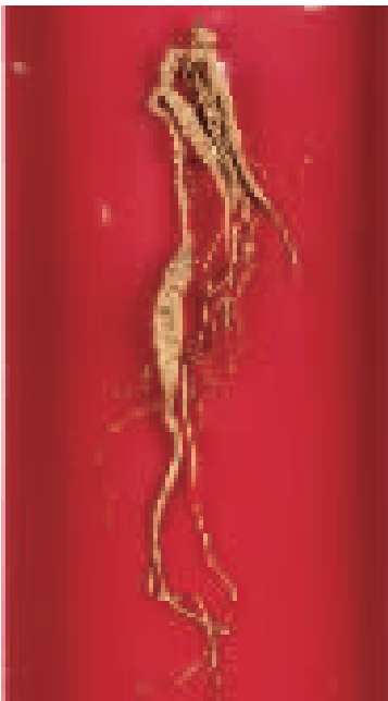
直营店参龄70年以上特级野山参

多年前,大晟灵芝孢子粉通过几十项质量安全检测,成功出口日本,是日本知名灵芝孢子粉品牌,大晟也是浙江省灵芝孢子粉炮制规范制定单位。