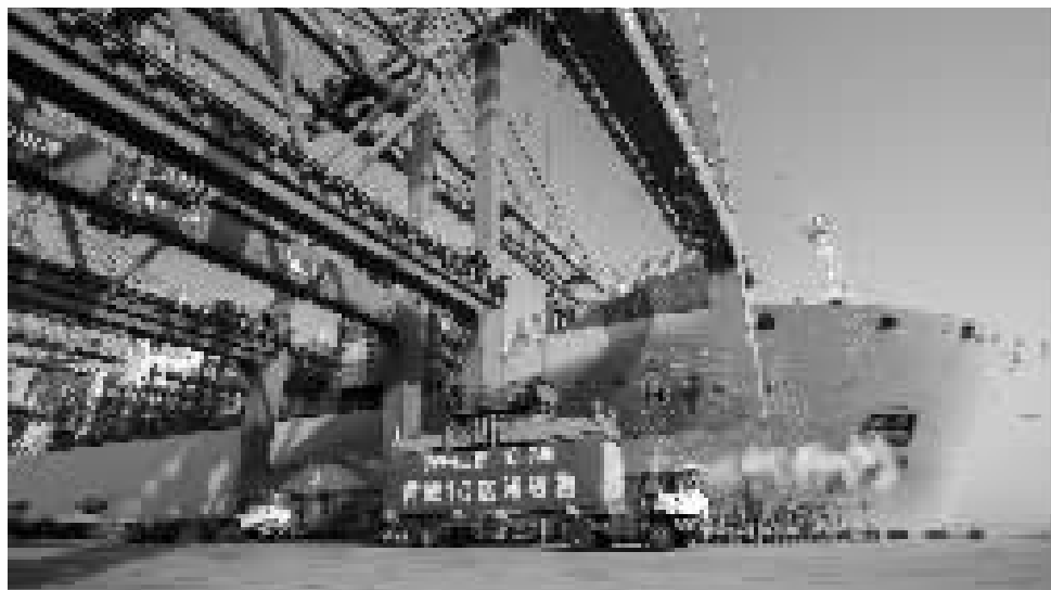
昨天上午，宁波舟山港举行年货物吞吐量首破10亿吨起吊仪式。

商报讯（记者 范洪 劳育聪 通讯员 胡泽波 黄啸）昨天上午9时15分，宁波舟山港穿山港区集装箱码头6号泊位，一只身披“红妆”的集装箱被稳稳吊装至“美瑞马士基”轮，至此宁波舟山港成为全球首个年货物吞吐量超“10亿吨”的大港。