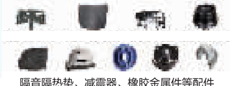
隔音隔热垫、减震器、橡胶金属件等配件