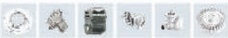
新能源汽车铝制零部件