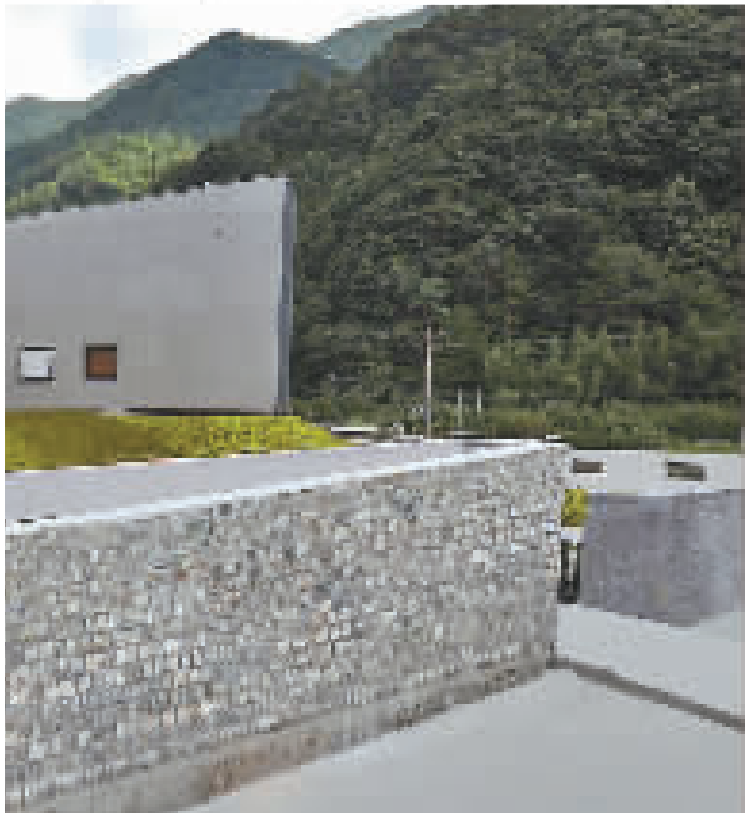
杜岙村内的美术馆