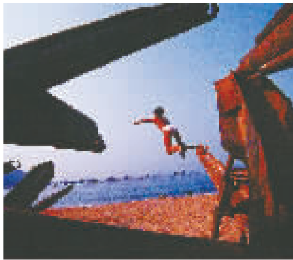
楼宇浩的摄影作品