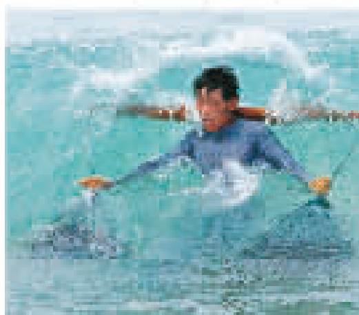
楼宇浩的摄影作品