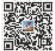
“东南风”微信客服号

糖糖饅饅：制造业是宁波的根本与基础，而信息产业是助力宁波腾飞的又一大引擎。“姜太公网”面对的工程行业这个巨大市场，机遇与挑战并存，从事工程相关行业的人了解过后肯定就能发现其意义与价值。