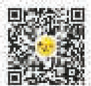
宁波创业圈微信号