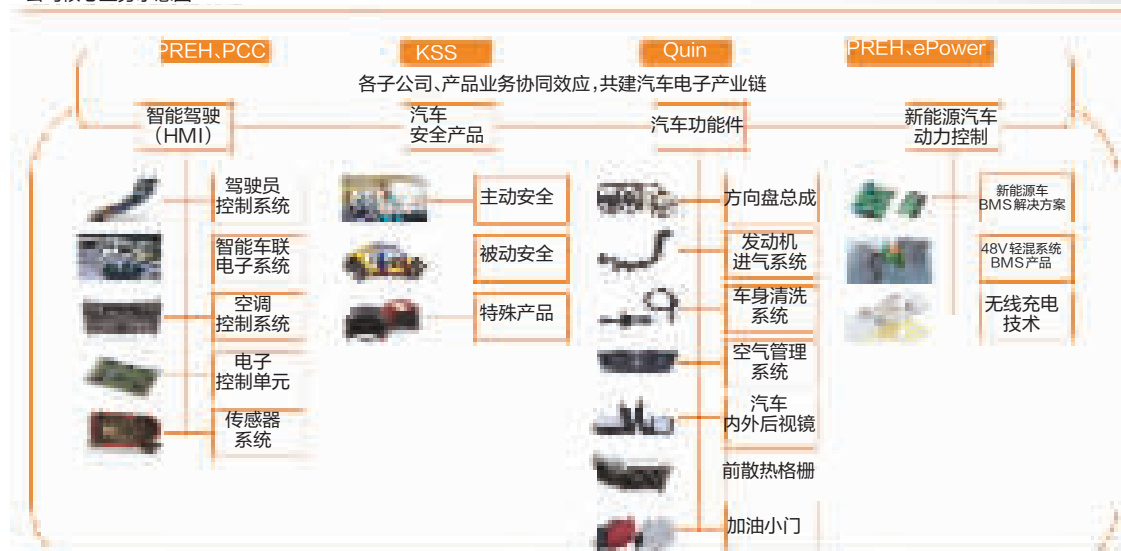
公司核心业务示意图