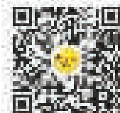
宁波创业圈微信号