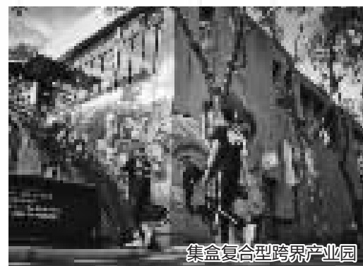
集盒复合型跨界产业园