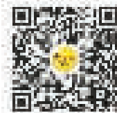
宁波创业圈微信号

需要未雨绸缪的是，还要关注其他弱势货币经济体的表现，这样可以对土耳其里拉危机的传导效应做出预判，进而减少可能的损失。