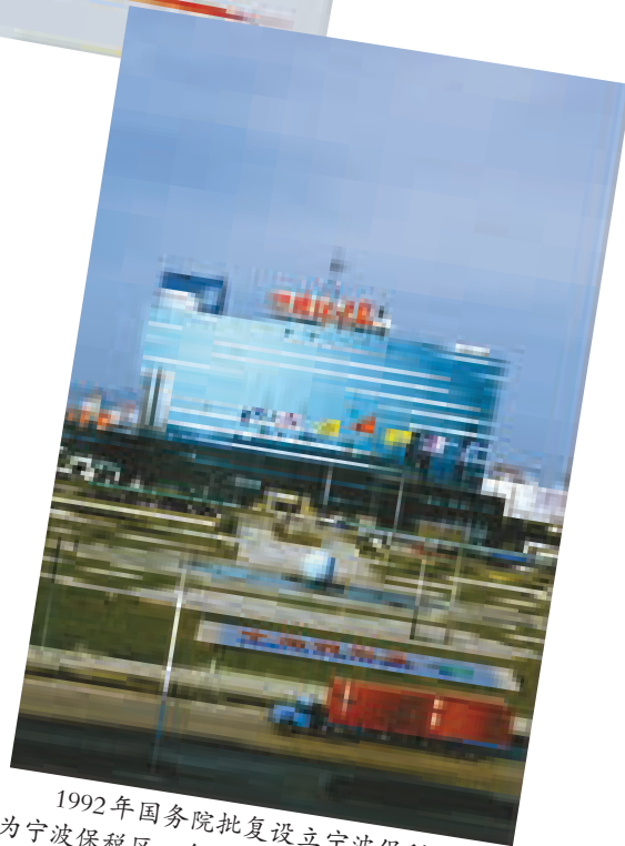
1992年国务院批复设立宁波保税区，图为宁波保税区一角。