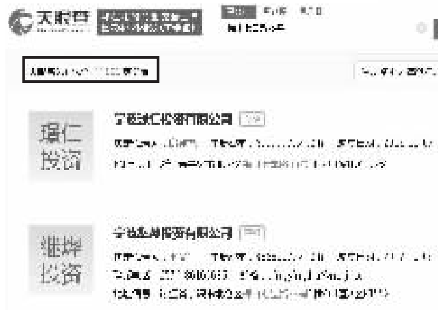
梅山七星路投资机构扎堆。 据天眼查

我们期待，梅山保税区这个资本集聚的新贵，能成为助力宁波高质量发展起飞的重要一翼！