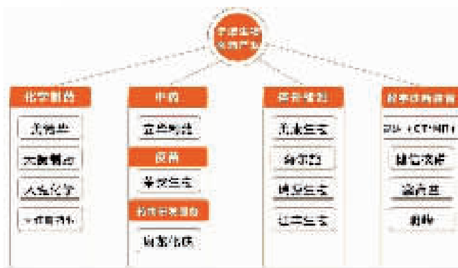
宁波生物医药产业布局