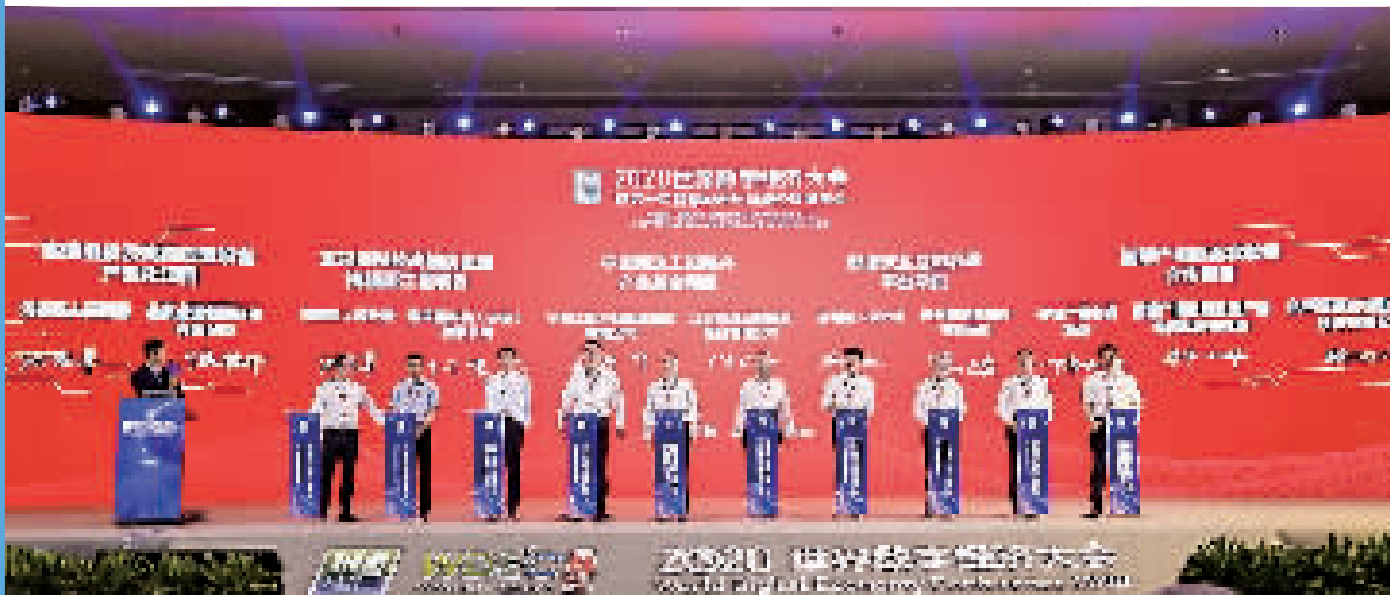
第十届智博会重大项目签约仪式。