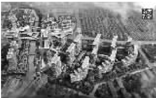
姜山未来社区设计意向图。据“南方设计”微信

鄞州区发改局表示，划船未来社区征收拆迁体量大、情况复杂，启动拆迁需要多方论证，目前划船未来社区征收方案正在论证完善中，如有进一步消息会第一时间公布。