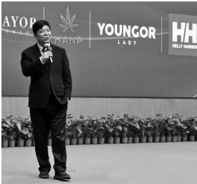
雅戈尔集团2020年度经济工作会议，HH已经出现在李如成讲话的背景PPT中。

公告称，此次投资成立的雅戈尔时尚（上海）科技有限公司，注册地址在上海市闵行区沪青平公路277号5楼，经营范围十分齐全。