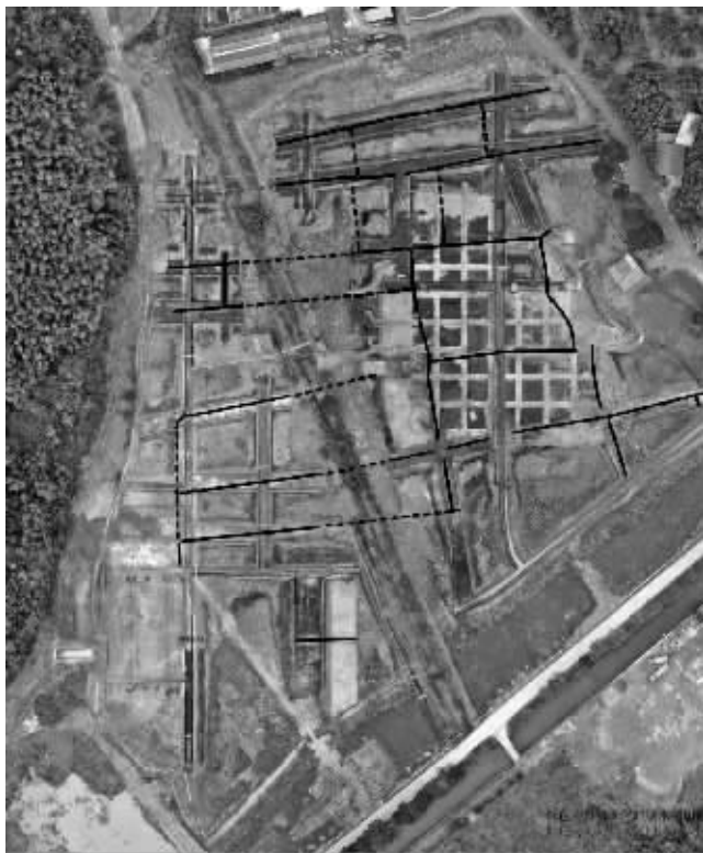
施岙遗址水稻田道路系统

同时，设立河姆渡农业奖，面向全世界的水稻、茶树等农业生产国家和地区，颁发给在农业领域做出巨大贡献的国际著名人士，成为农业领域“诺贝尔奖”。