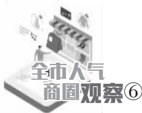
全市人气 商圈观察⑥

“三年打造宁波主城区北部商业中心”的恢弘画卷已铺陈开来，镇海商业“长风破浪会有时”。