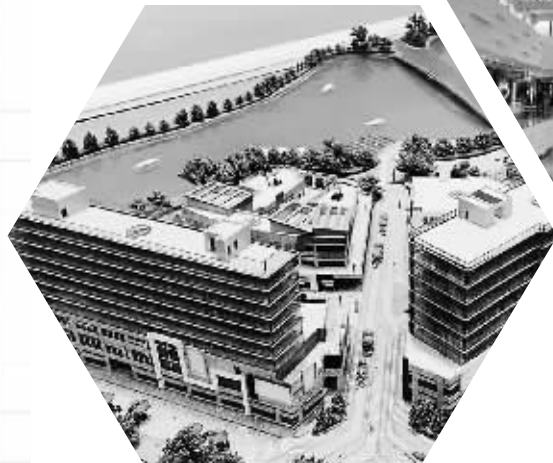
宁波开元广场的沙盘