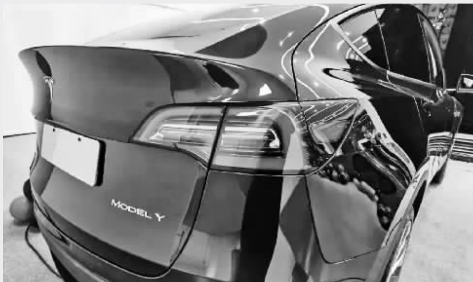
特斯拉 Model Y

根据召回数量、缺陷比率估算，拓普集团认为，本次召回为非重大事件，不会对公司年度经营业绩产生影响，本次事件也不会对公司业务产生影响。