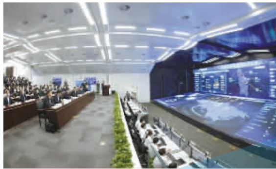
宁波智能公共数据平台。

不过，在政府网站绩效评估中，宁波的表现还有较大的提升空间。在“2021副省级城市政府网站前10名”中，有9座副省级城市排在了宁波前面，其中，青岛和深圳并列第一，厦门和成都并列第二，宁波的政府网站建设还需向这些城市多“取经”。