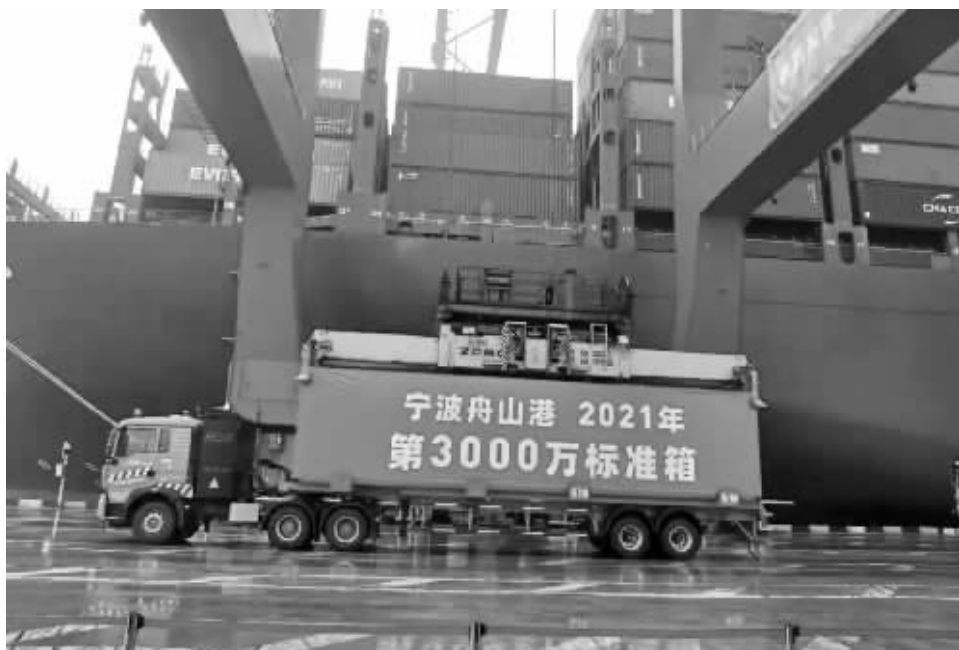
12月16日上午8时30分，在宁波舟山港梅山港区7号泊位，今年第3000万标箱正在被吊装至19万吨巨轮中远海运“双鱼座”号上。