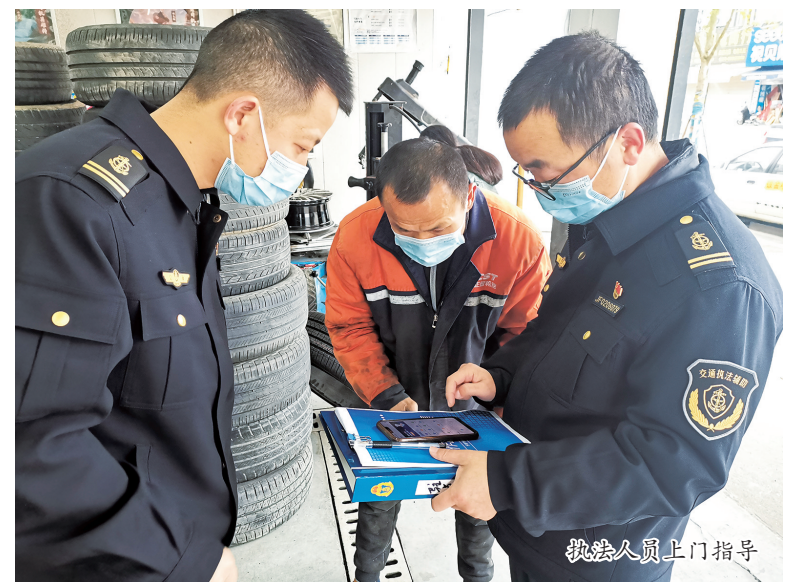
执法人员上门指导

加强政策宣传解读。组建汽车维修电子健康档案微信群，宣传电子健康档案政策，下发维修企业电子健康档案接入指南，图