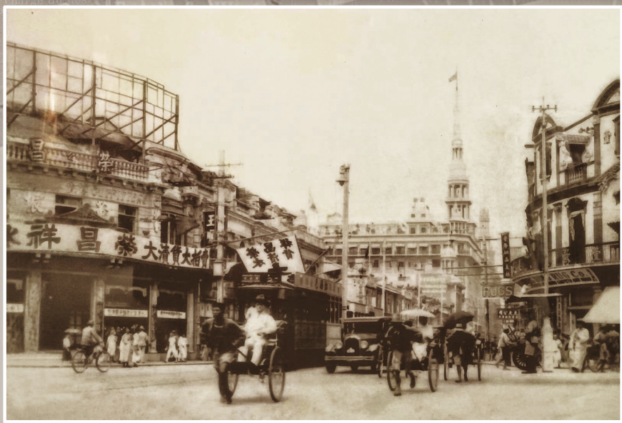
▲1910年上海南京路街景