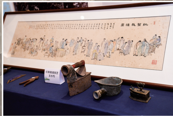
奉化区非遗馆征集的部分红帮裁缝用具

每逢春秋两季,店里给做过衣服的老顾客一一发信,告诉顾客:“现在是换季之时,新货已到,恭候您的光临。”信中附上面料小样,注明品质特色、流行情况。没有需求,创造需求。顾客收到这样周到热情的信件后,多会及时回信,或亲自来店定制。一套“驯衣功夫”下来,只能说宾至如归了。