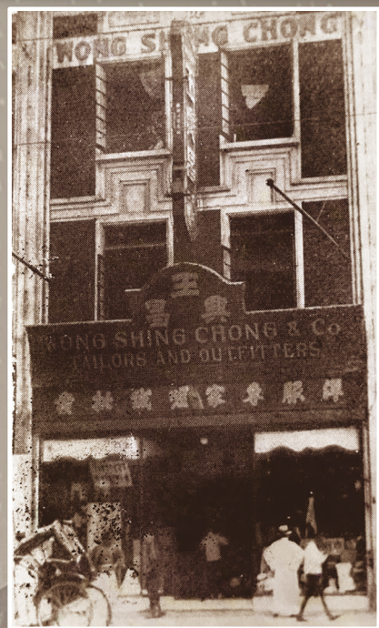
1911年开设在上海南京路的王兴昌洋服号