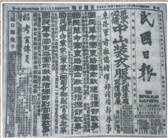
红帮名店荣昌祥有关中山装广告

“西装第一要讲料子,一定要英纺,纯羊毛的,夏天,派立斯、凡立丁,冬天嘛,法兰绒、轧别丁、舍维呢,都要英国花呢的。”在红帮裁缝的巧手下,爷叔从面料到款式、用途、设计的“讲究”被一一具象。“人靠衣装,马靠鞍”,西装上身,“毛头小子”霎时呈现出了低调奢华有内涵的商人“派头”。归于现实,这是剧情的艺术夸张,还是宁波红帮裁缝真有这么“灵”?