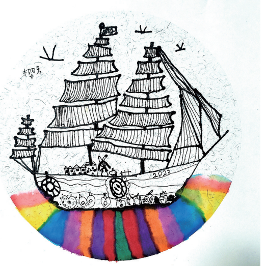
扬帆起航 实验小学112班小记者 黄樱若