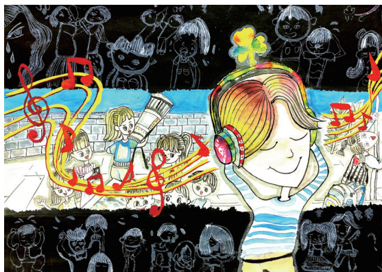
智能耳机畅想曲 居敬小学106班小记者 毛跃雯