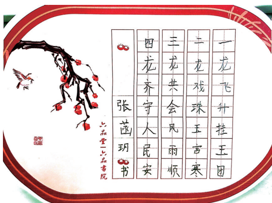
书法赏析 凤鸣未来学校106班小记者 张茜玥