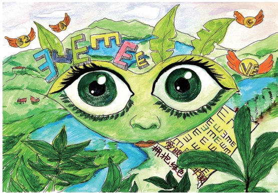
接近绿色 居敬小学303班小记者 李若嫣 指导老师 陈红