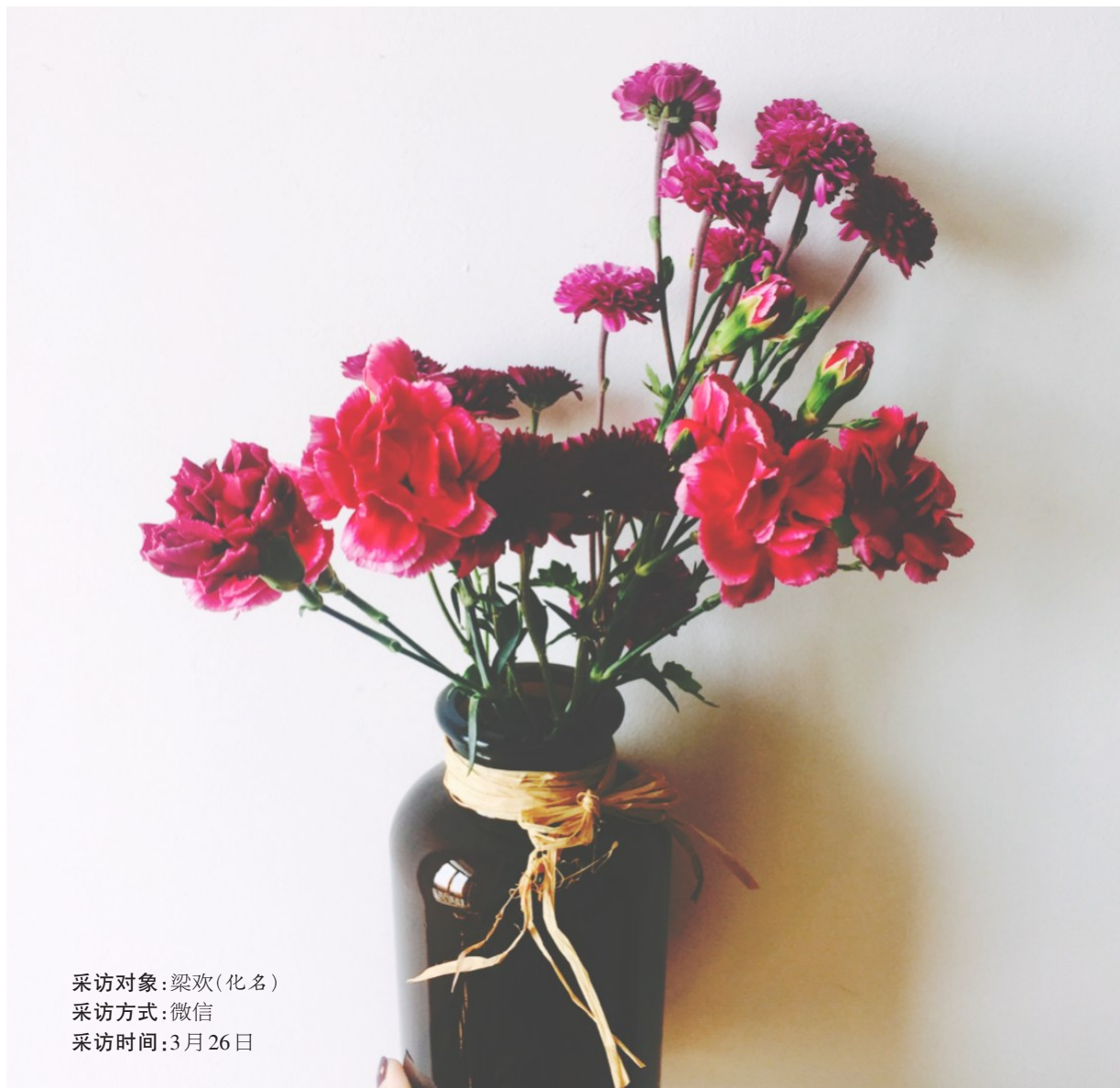
采访对象:梁欢(化名) 采访方式:微信 采访时间:3月26日

你有过身不由己的时候吗?你曾经因为父母的偏心,在夜深人静时痛哭流涕过吗?如果再给你一次生命,你是否想重新选择出生呢?