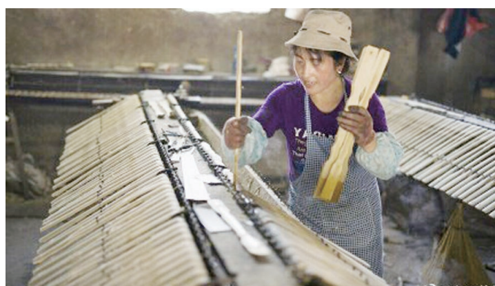
九哥旅拍: 奉化岩头古村周边山上, 竹子茂密, 附近村庄分布着许多竹制品的加工作坊, 图为挠痒痒的制造工序。