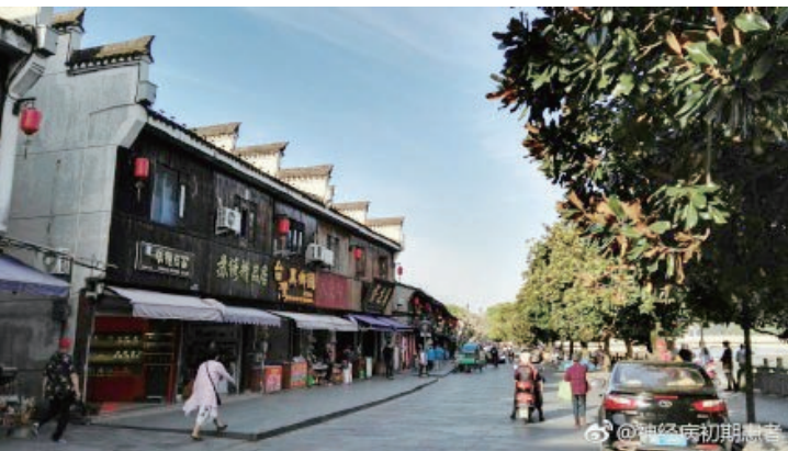
神经病初期患者: 偶遇奉化溪口小镇。