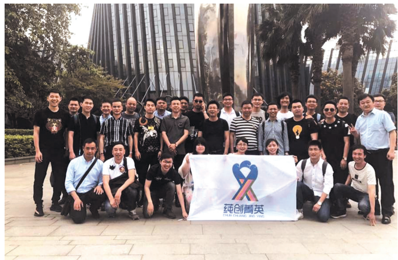
“蕲湖创投菁英联盟”成员在华为总部学习考察后留影。