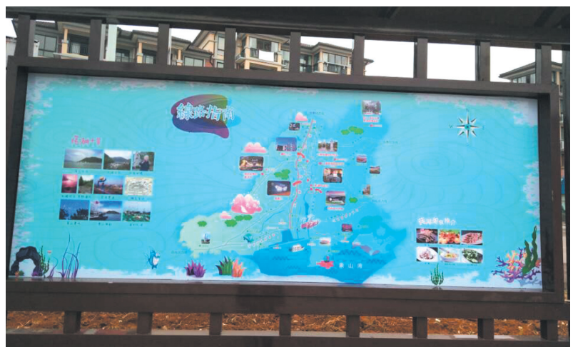
统战宣传长廊统战示范风景线路线指示牌。