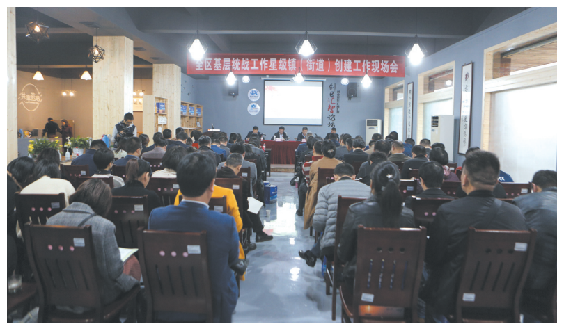
全区基层统战工作星级镇(街道)创建工作现场会。

重点突出打造以奉化二中为核心的重点校友陈列室,将多年来,涌现出的一大批在国际国内享有盛誉