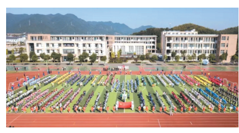
图为蕲湖镇尔仪小学足球嘉年华开幕仪式。

目前,该校每班都组建了班级足球队,每学期均举行一次班级联赛,成绩列入班级管理考核。“以球育德、以球健体、以球促智”教育理念渐渐结出了丰硕果实。