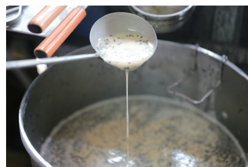
鸡蛋、白糖、芝麻面糊