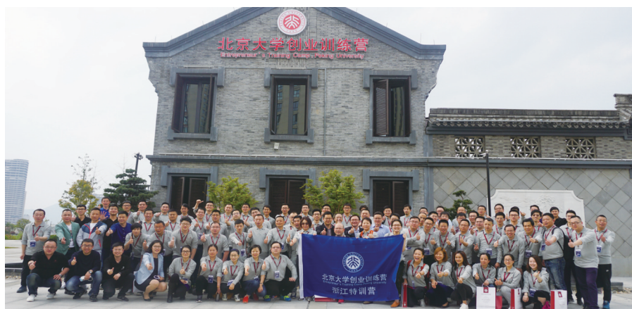
北京大学创业训练营开班