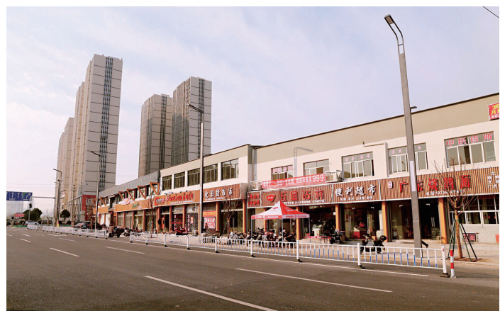
中山路街景整治图

如果说多年前,奉化大学生毕业后因失落于“理想就是离乡”远赴杭州、上海、北京甚至海外打拼,那么近年来,甬台众创小镇里的一个个众创空间,从政策引导、荣誉激励、待遇优惠和服务保障等多角度为返乡的有志之士铺起沃土,让创新创业的种子得以快速成长。在我区经济增速换挡和动能转换的背景下,甬台众创小镇正以风起云涌之势掀起我区的返乡创业热潮。