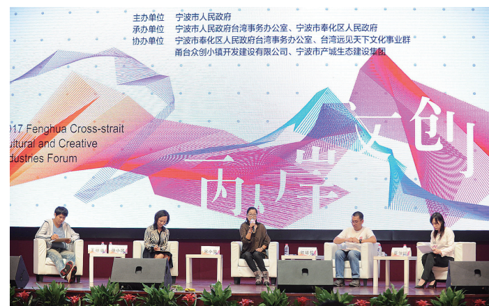
2017海峡两岸文创论坛