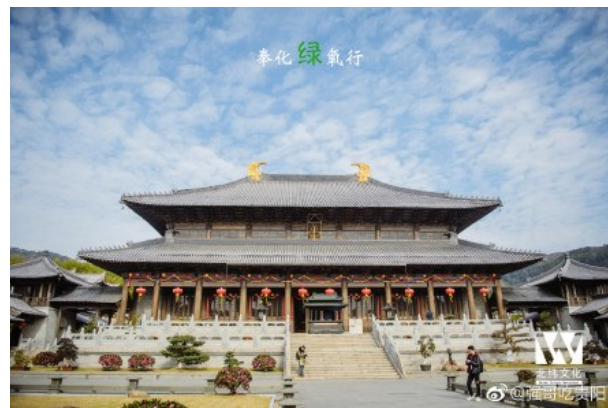
@强哥吃贵阳: 奉化绿氧行。——12月11日