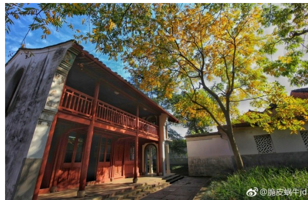
@脆皮蜗牛jd: 秋日溪口。——12月9日