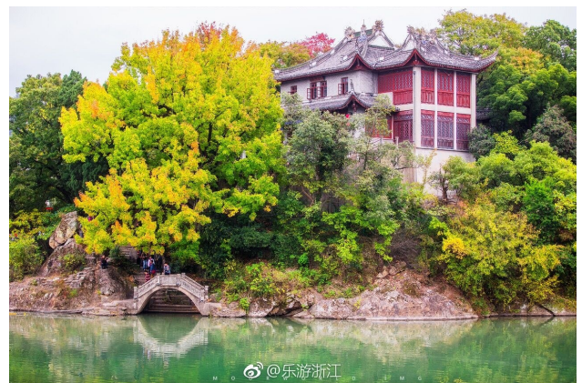
@乐游浙江:溪口民国往事只待回忆。——12月26日