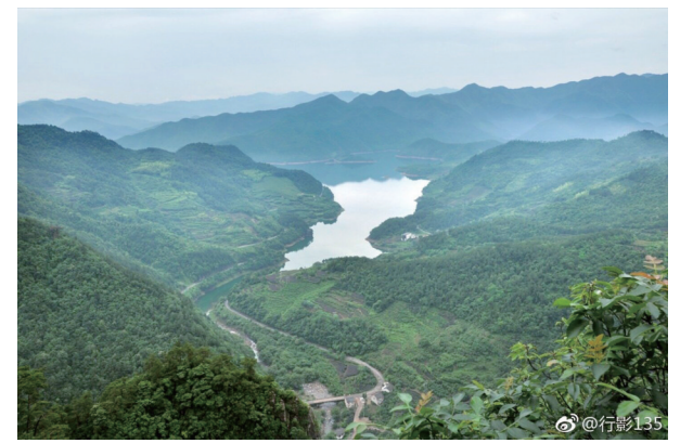
@行影135:奉化溪口妙高台,周围松樟翠竹蔽日,脚下山岩奇突多姿。——12月21日