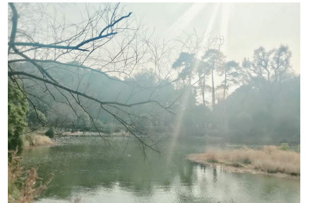
@暮影归舟寻香来:一早起来去爬奉化的雪窦山,一直到半山腰,看到一个小湖泊,阳光下波光粼粼,十分惬意。——12月24日