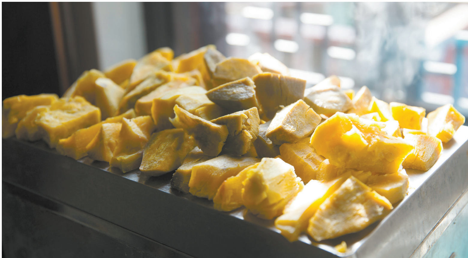
在水箱上烘烤的番薯卷