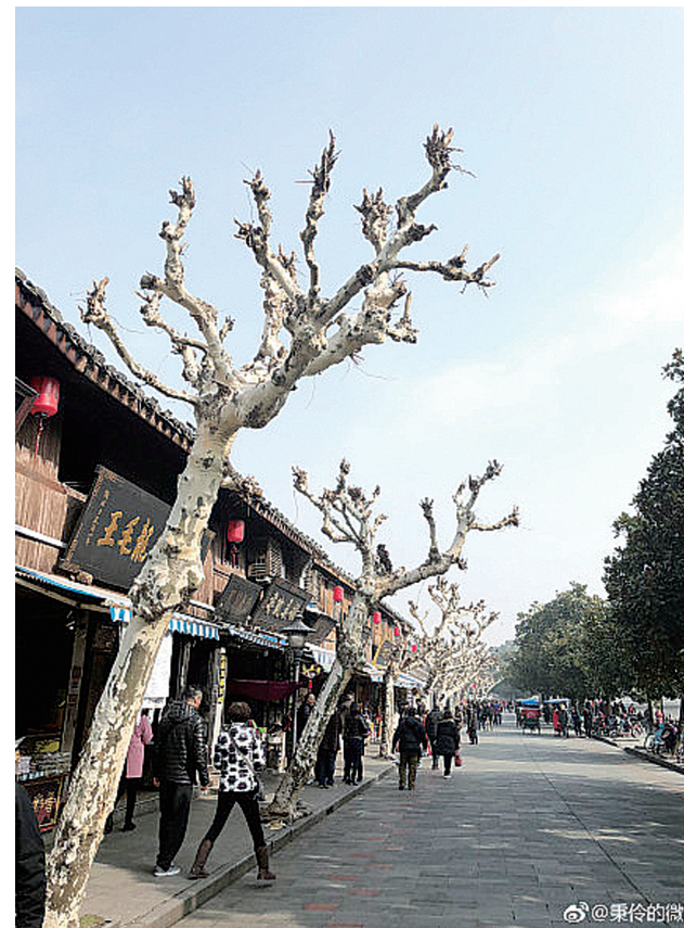
@秉伶的微博:奉化溪口蒋介石故居,因为出了一个名人,这里成了风水宝地,但是老蒋给家乡后人带来的旅游经济收入他恐怕不会想到。——1月1日