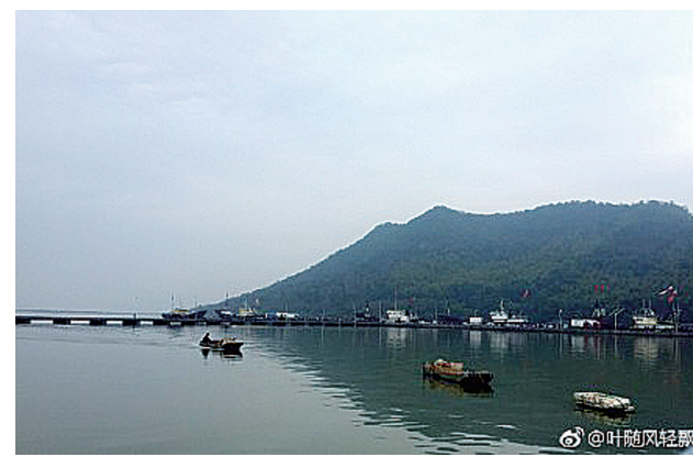
@叶随风轻飘:奉化桐照,中国第一渔村。——1月2日