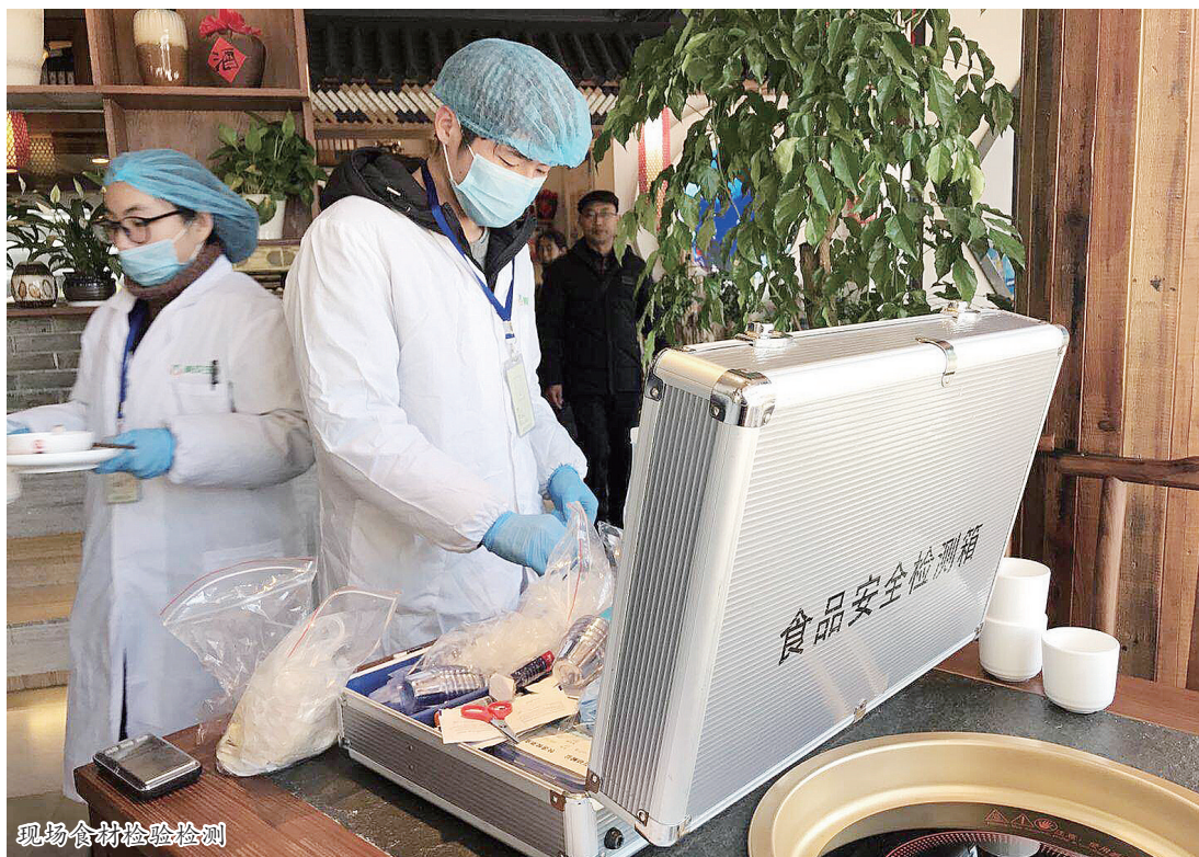
现场食材检验检测

1月9日,该局城区食品所执法人员对辖区沸辣火锅、好德火锅两家火锅店的部分食品原材料和餐饮具进行了快速检测。抽检人员随机抽取了厨房冷柜、操作台、消毒柜、保洁柜及仓库间的蔬菜、肉类、汤底、餐饮具共20多批次的样品,主要检测农残、瘦肉精、罂粟壳、甲醛等民众最为关心的项目。目前,检测结果均符合相关国家标准。