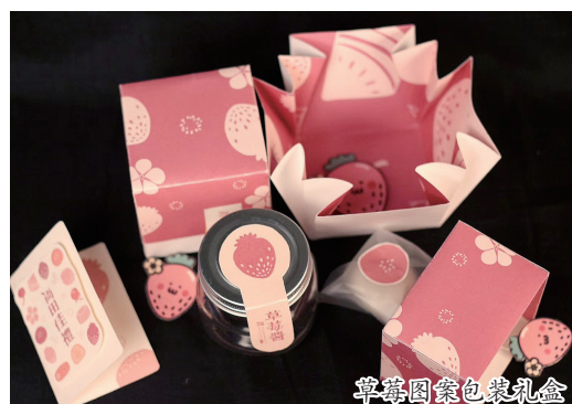
草莓图案包装礼盒