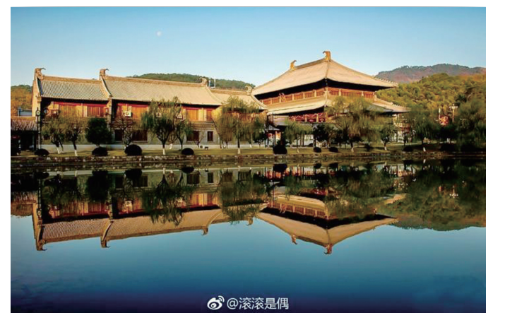
@滚滚是偶:走遍千山万水，溪口风景总有一处让你向往，雪窦寺。