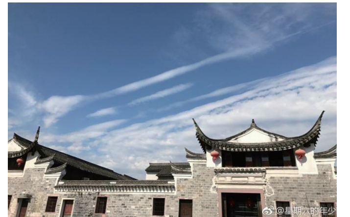
@星期六的年少:走马塘边走，寒云澹放晴。