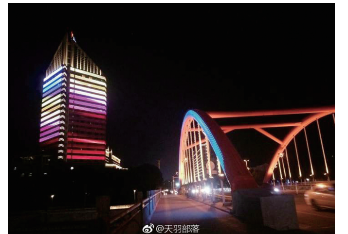
@天羽部落:奉化夜景。