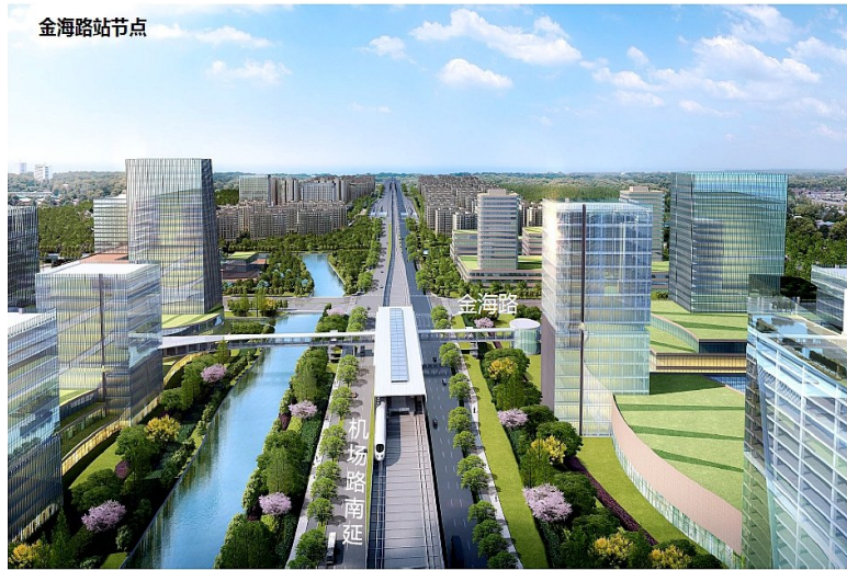
其中岳林东路至湖桥东路段站间距为0.7公里，湖桥东路至宝化路路段站间距为1.2公里。 图为金海路站节点鸟瞰效果图

机场路南延与主次干道相交的路口进口道至少满足五车道的要求。部分转向需求较大的路口，满足五车道的要求，如湖桥东路、宝化路。全线共布置4对公交停靠站，