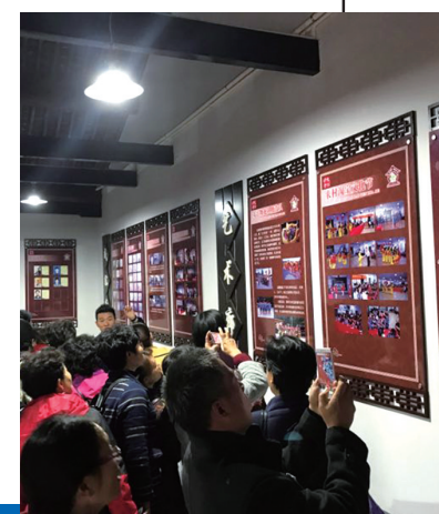
王淑浦村红帮展馆

村级文化礼堂建设,是农村文化建设的“升级版”,是推进美丽乡村建设的“助推器”。村级文化礼堂是农村举办各种文化活动的场所,是巩固农村思想文化的重要阵地。