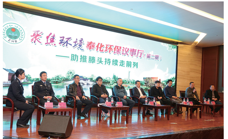
聚焦环境·奉化环保议事厅

去年以来,区环保局深入开展干部作风大整治活动,转作风、优服务、抓实效,将部分工作重心转移到扶持、帮助、指导企业中去,坚持打击环境违法行为与优化服务并重,助力企业转型升级。