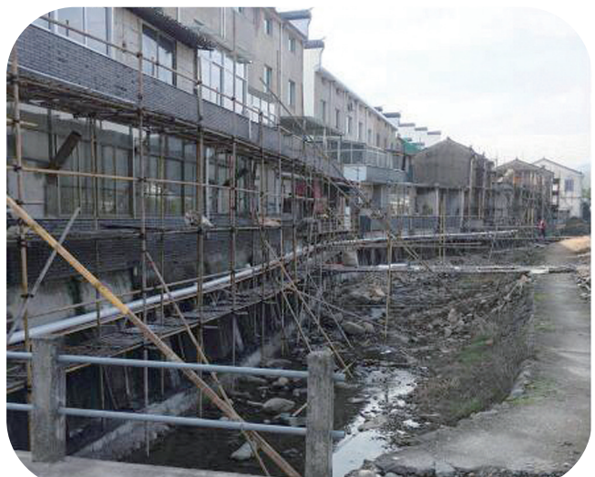
大堰镇沿河截污纳管工程