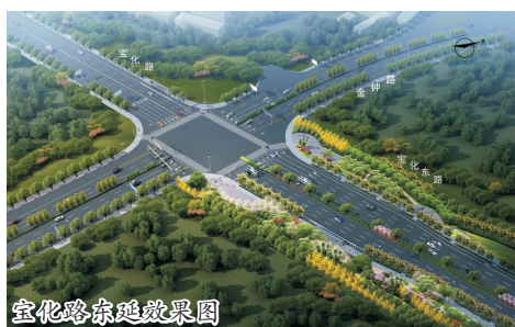
宝化路东延效果图