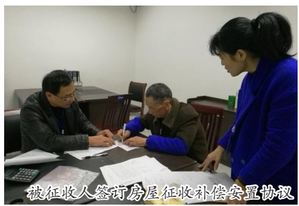
被征收人签约房屋征收补偿安置协议