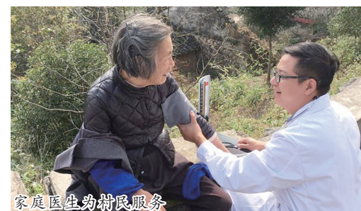
家庭医生主动上门服务