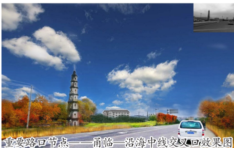
重要路口节点——甬临—沿海中线交叉口效果图