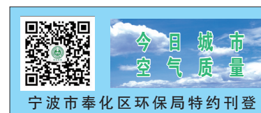
宁波市奉化区环保局特约刊登