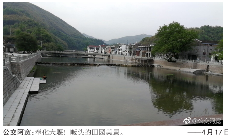
公交阿宽:奉化大堰! 堰头的田园美景。——4月17日