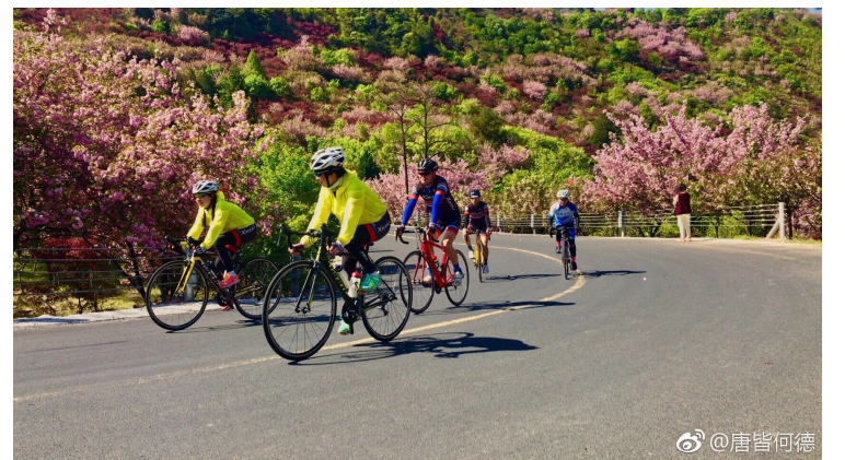
唐皆何德:坐标:奉化徐凫岩! 这个路口常有摄影师出没噢。——4月9日