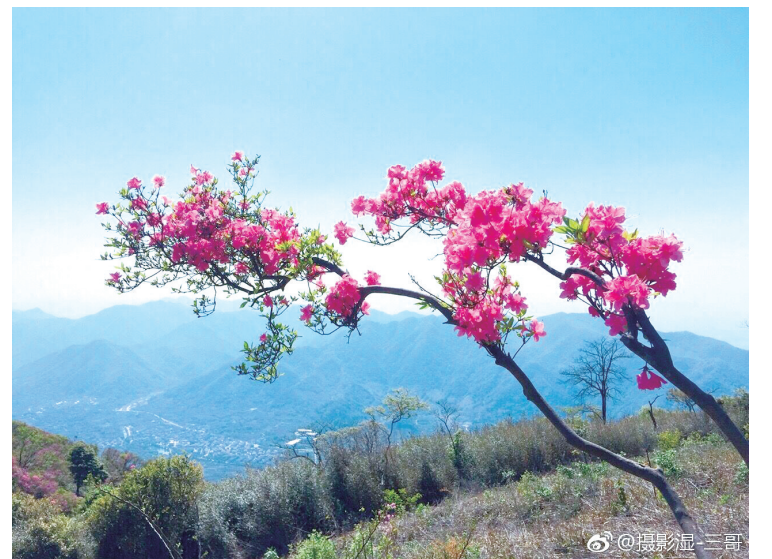
奉化金峨山杜鹃。——4月18日