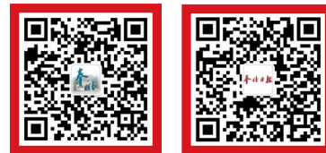
奉化发布 奉化日报