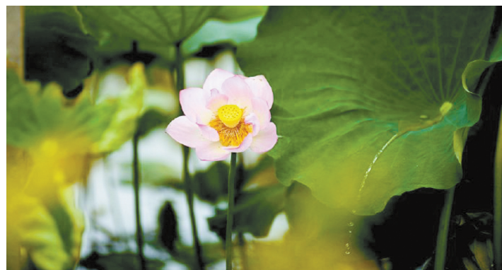
@浙江奉化水手长:碧荷生幽泉,朝日艳且鲜。秋花冒绿水,密叶罗青烟。秀色粉绝世,馨香谁为传?坐看飞霜满,凋此红芳年。结根未得所,愿托华池边。