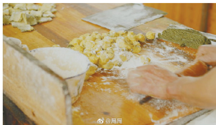
@局局:制作奉化特产千层饼。