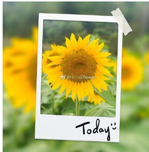
@王小花flower-:尚田鹤村向日葵。 6月17日