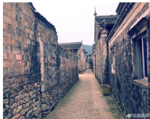
@大叔向红:院线电影《烛仙》在奉化马头村拍摄中。风景不错了解一下。 6月16日