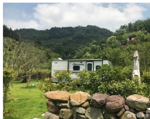
@瑞典美食家:端午假期,奉化山里寻清静。 6月16日