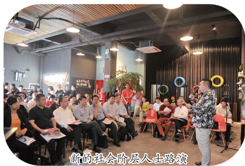
新的社会阶层人士路演