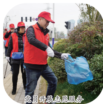
党员开展志愿服务