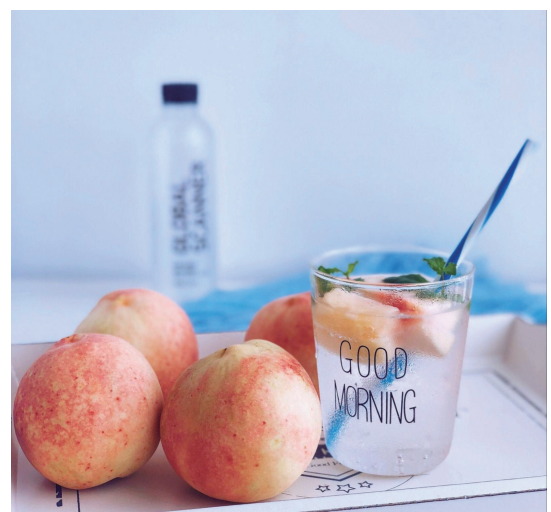
@是佐拉呀:没有奉化水蜜桃的夏天是不完整的! ——7月11日