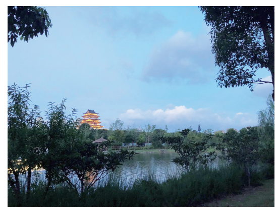
@莫小北的梦幻:台风来临前的奉化! ——7月11日