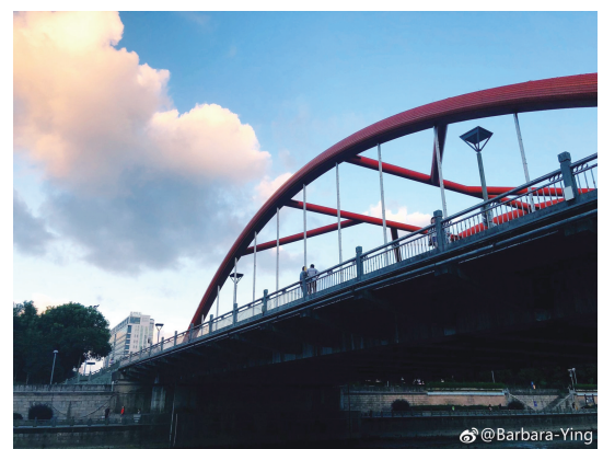
@Barbara-Ying:奉化夜色感人。 ——7月10日